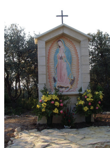
24. LE BARROUX